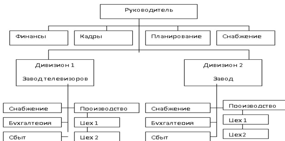
Рис. 5. Организационная структура предприятия

Иллюстрации. Графическое оформление выпускной квалификационной работы может быть представлено в виде графиков, диаграмм, схем и т. п. Все иллюстрации (фотографии, схемы, графики, диаграммы) именуется рисунками. Иллюстрации, как в тексте работы, так и в приложении должны быть выполнены на стандартных листах белой бумаги. Рисунки нумеруют (если их в работе более одного) сквозной нумерацией в пределах всей выпускной квалификационной работы (до приложений к ней) арабскими цифрами. Единственная иллюстрация в работе не нумеруется. Каждый рисунок должен сопровождаться надписью, которая делается с лицевой стороны, и составляется в следующем порядке: – условное сокращение название иллюстрации – «Рис.»; – ее порядковый номер арабскими цифрами; – название иллюстрации. Название иллюстрации всегда начинают с прописной буквы. В конце названия точки не ставят. Размещают название под рисунком, например: